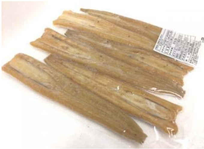
ATサーモンハラススライス8g

冷蔵で解凍後すぐ食べられます。 加熱の必要ありません。 1k/約300~400個入りです。 どんぶり、寿しネタに最適です。 他の商品と同胞も可能です。 よろしくお願いいたします。