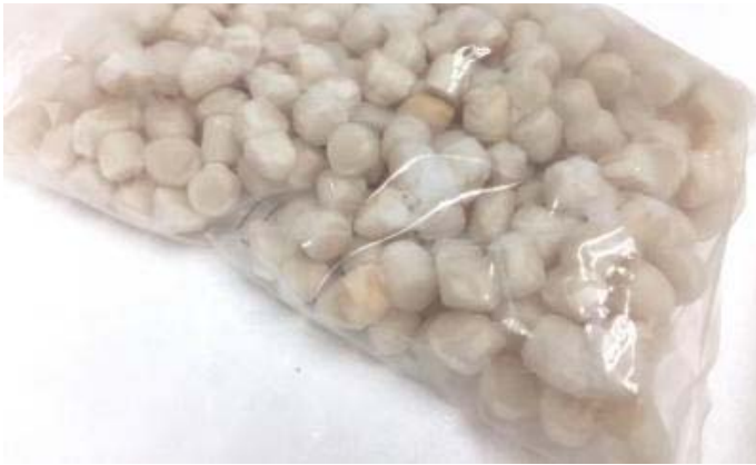
天然踊り活き 煮穴子6尾 250g