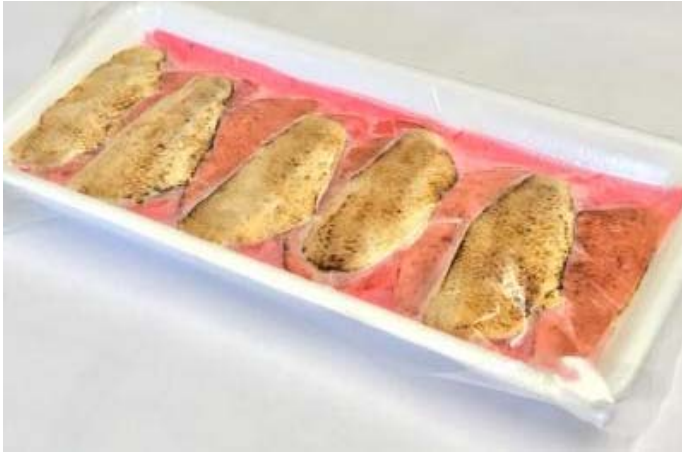
ボイル真タコスライス 6g