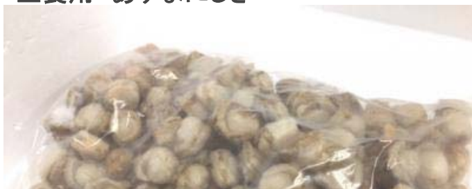
生食用 あずまにしき

冷蔵で解凍後すぐ食べられます。 加熱の必要ありません。 1p/20枚入りです。1枚8gです。 一梱包で最大100p前後入ります 他の商品と同胞も可能です。 よろしくお願いいたします。